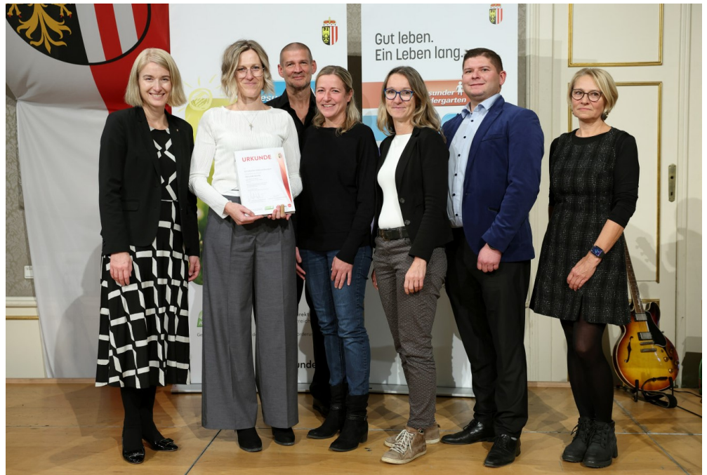
Die Schulkinder, Kindergartenkinder und die Kinder der Krabbelstube freuen sich über das gesunde und gschmackige Essen!

Von Beginn an war sie bestrebt, die Schulküche schrittweise in eine gesunde Küche umzustellen und ist damit auch dem Wunsch der Gemeinde nachgekommen. Ihr großes Engagement wurde nun bereits zu Beginn der Herbstferien gewürdigt mit der Einladung von Frau Mag. Christine Haberlander zur Auszeichnungsveranstaltung Gesunde Küche, am 25. Oktober 2024 in den Redoutensälen in Linz.