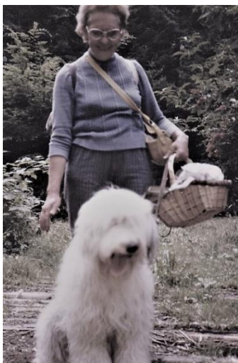
Ein Spaziergang in der geliebten Natur