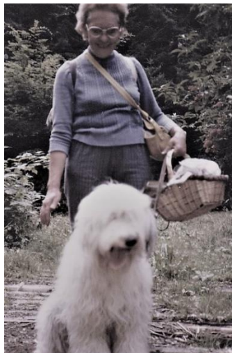
Ein Spaziergang in der geliebten Natur