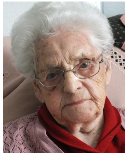
Ein erfülltes, immer engagiertes Leben zeichnet sie im Alter

Haus- und Dorfgeschichten aus Unterweikersdorf - Folge 1: Die Dorfkapelle Unterweikersdorf und Folge 2: Das „Lindner Häusl“ können kostenlos bei der Gemeinde bezogen werden. Die nächste Folge 4: beschreibt die Schießler-Kapelle in Gauschitzberg.