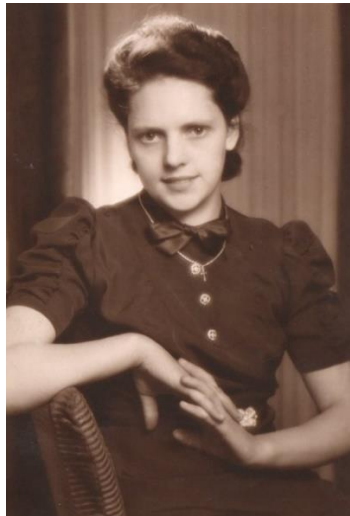
Die Ausbildung steht bevor