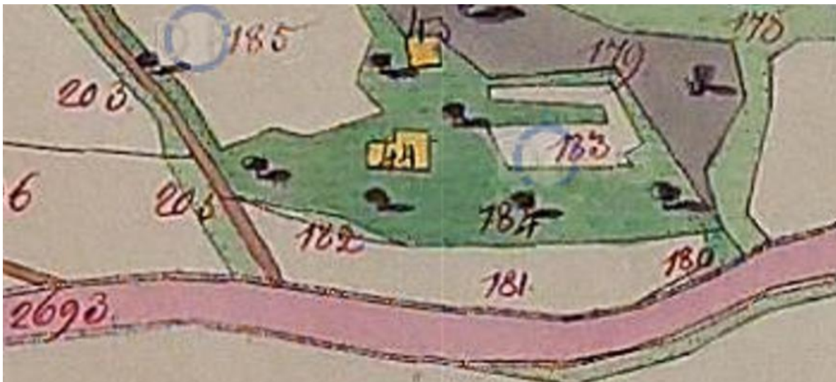
Urmappe aus 1824

Errichtet wurde das Haus als ebenerdiger Bau ohne Obergeschoß auf einem Steinfundament. Die Zwischenwände bestanden überwiegend an den Enden aus Kanthölzern, dazwischen waren Äste bzw. Astgabeln eingestellt die mit einem Lehm-Stroh-Gemisch verputzt waren.