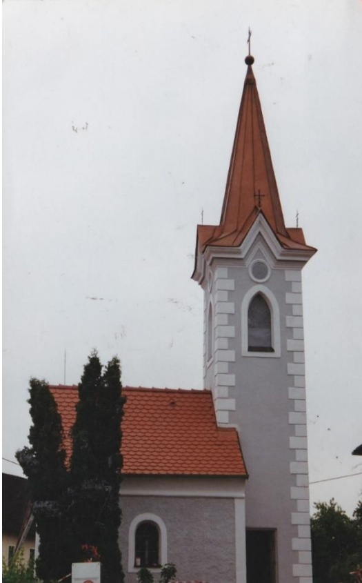
Die Kapelle nach der Renovierung 1995